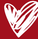
TABLE DE L'ESPOIR TABLE OF HOPE 2019