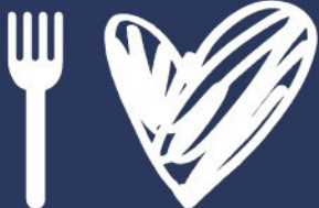
TABLE DE L'ESPOIR TABLE OF HOPE 2019