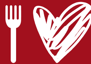
TABLE DE L'ESPOIR TABLE OF HOPE 2019

Depuis 2008, la Table de l'espoir est l'événement-bénéfice le plus important de Partageons l'espoir, jouant un rôle capital pour la vitalité et le financement de son programme alimentaire scolaire. Cet événement de collecte de fonds est devenu au fil du temps un événement gastronomique fort couru à Montréal. Le soutien de partenaires de qualité et les quelque 600 convives enthousiastes qui année après année participent et appuient Partageons l'espoir, en font un événement unique.